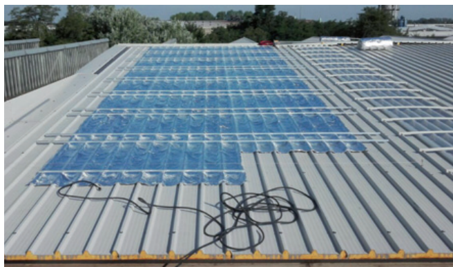
Over-foil Nest come strato ignifugo sotto pannelli fotovoltaici